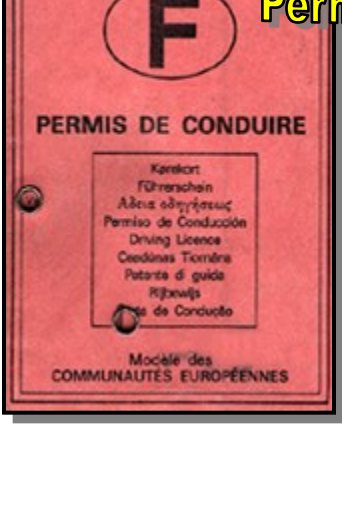
Permis de conduire