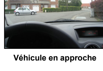
Véhicule en approche